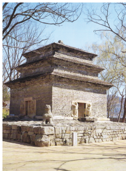
(다) 경주 분황사 모전 석탑