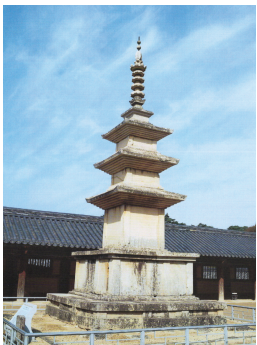
(나) 경주 불국사 3층 석탑